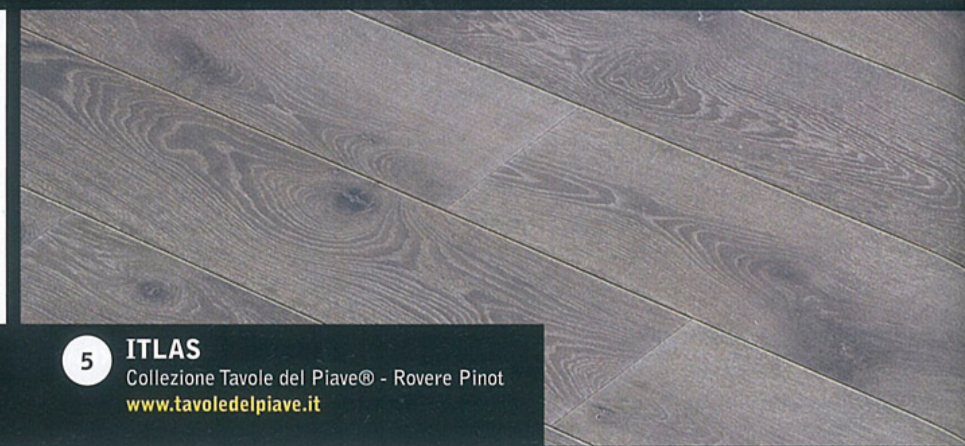
5 ITLAS Collezione Tavole del Piave® - Rovere Pinot www.tavoledpiave.it

1 Oltre al nome, condivide con gli aerei militari invisibili al radar la capacità di mimetizzarsi con la parete. È una porta d'ingresso di sicurezza perfettamente complanare, disponibile in grandi dimensioni, fino a 330 cm di altezza, on serratura a ingranaggi o elettronica. Nella versione qui presentata, è rivestita con pannello di larice naturale.